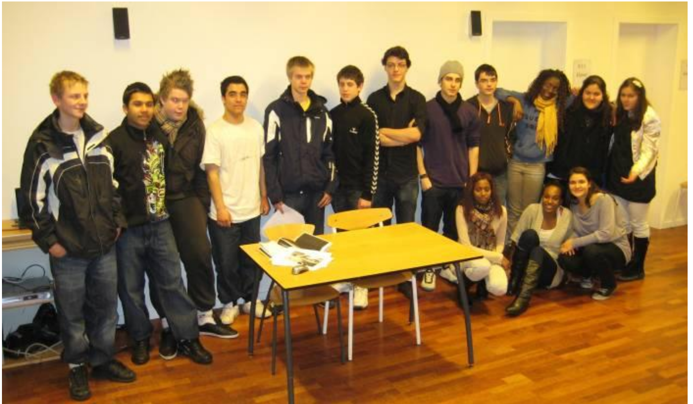
Alle 9/10. classes projektfremlæggere

Næste punkt i de to klassers kalendere er terminsprøverne, som afholdes i slutningen af februar. Bag efter skal vi vurdere hvem, der kan indstilles til gymnasier og de mange andre uddannelsesretninger – og hvem der skal have et år mere på skolen i 9/10. klasse for at blive mere fagligt sikre, så vi ved, at de kommer til at klare sig godt.