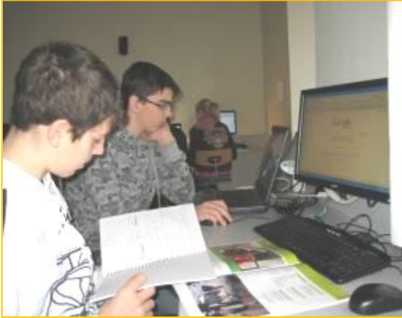
IT lokalet blev brugt flittigt

Mandag den 18. og torsdag den 19. var det tid til fremlæggelser – eleverne var spændte, der var nerver på, men alle kom på scenen og lavede nogle gode fremlæggelser. Den ene dag hørte vi bl.a. om stoffer og kriminalitet – den næste handlede om uddannelser til ingeniør, tandlægeassistent, tømrer og dyrlæge.