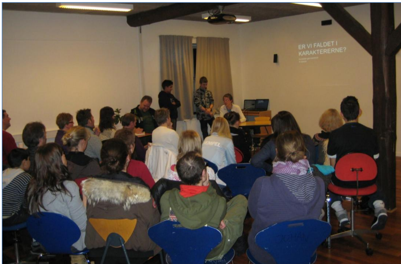
9. classes projekterne blev fremlagt af seks grupper

Den følgende uge forberedte eleverne deres fremlæggelser, og hele forløbet blev afsluttet med to afteners god underholdning med deltagelse af forældre, bekendte og gamle elever.